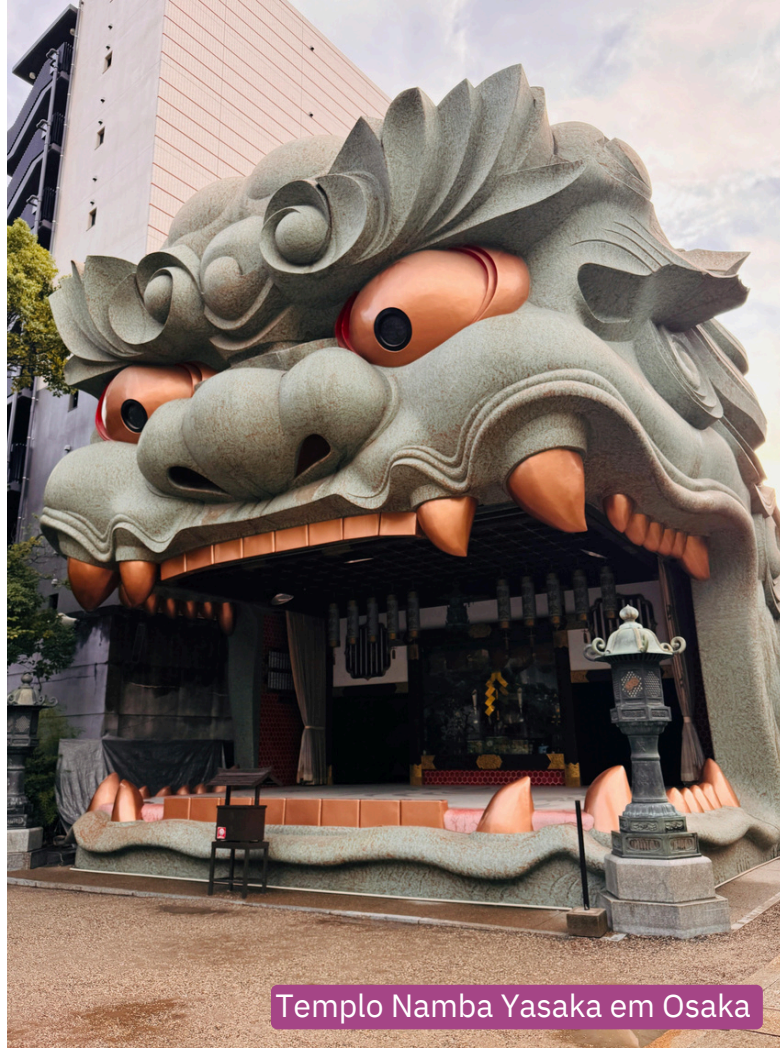
Templo Namba Yasaka em Osaka