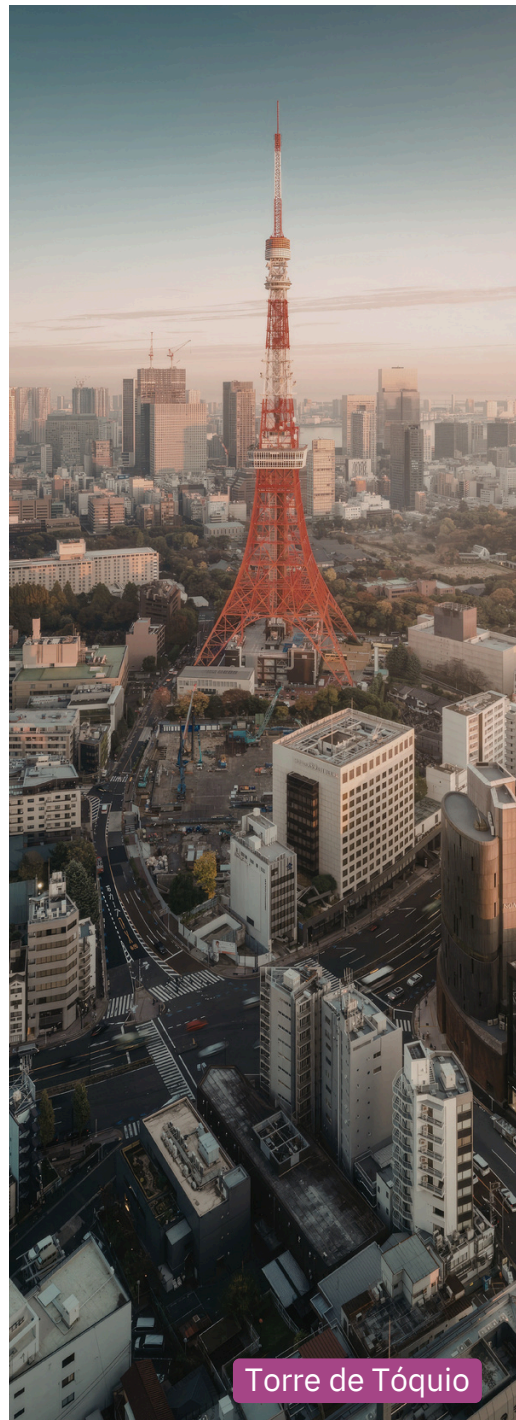
Torre de Tóquio