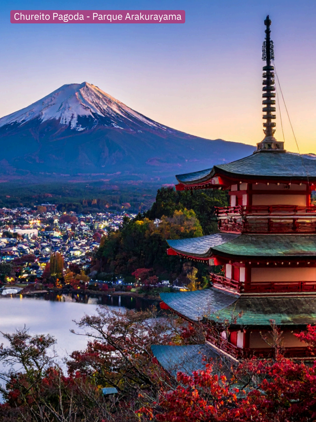
Chureito Pagoda - Parque Arakurayama