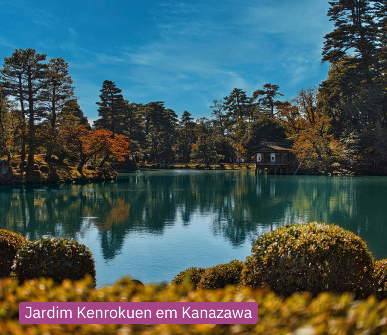
Jardim Kenrokuen em Kanazawa