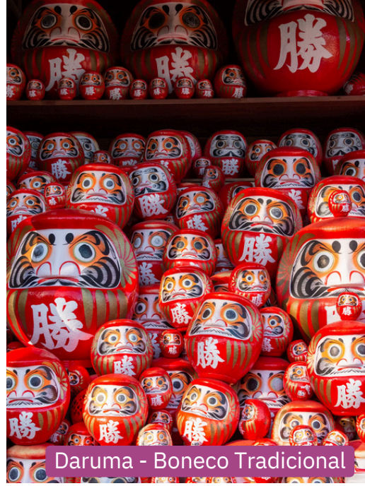
Daruma - Boneco Tradicional