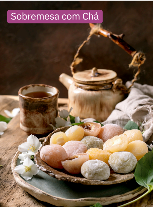
Sobremesa com Chá