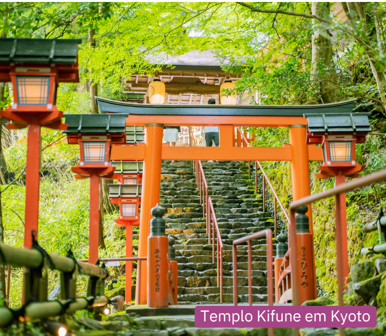
Templo Kifune em Kyoto