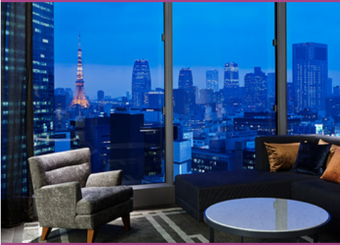
Mitsui Garden Hotel Ginza Premier