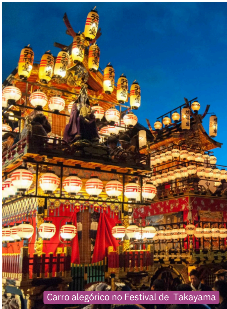
Carro alegórico no Festival de Takayama