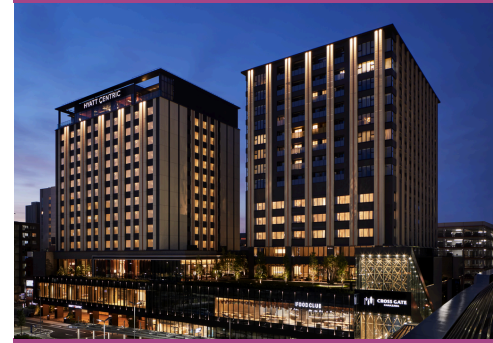
Hyatt Centric Kanazawa