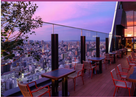
Centara Grand Hotel Osaka