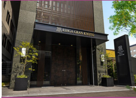
RIHGA Gran Kyoto