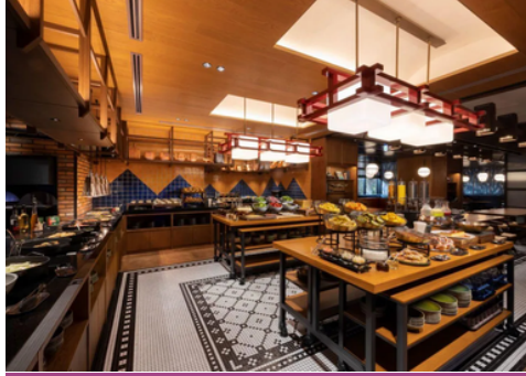
Mercure Hida Takayama