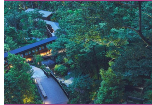
Hakone Kowakien Hotel