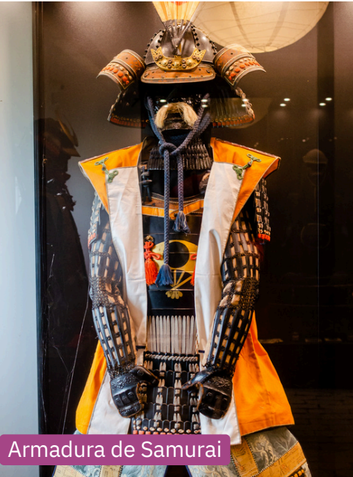
Armadura de Samurai