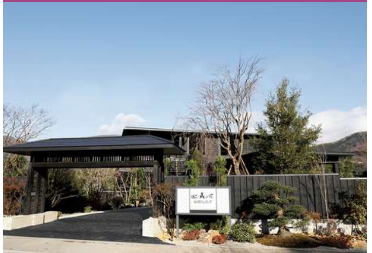
Hotel Mori no Kaze