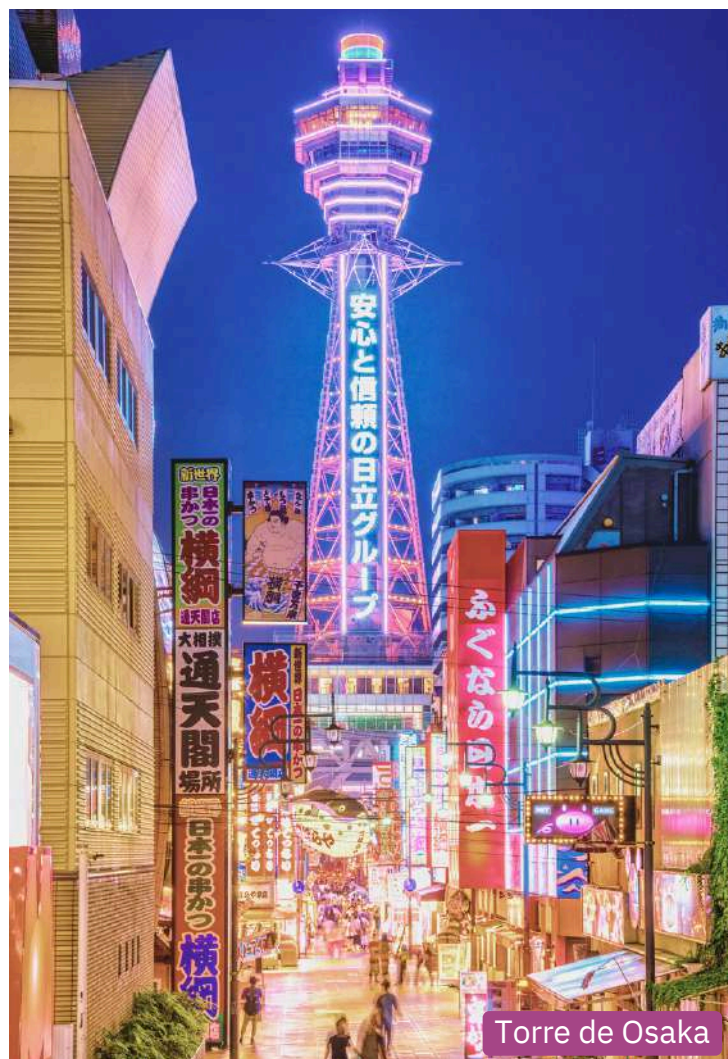
Torre de Osaka

Nosso dia começa na encantadora região de Arashiyama, situada ao oeste de Kyoto, conhecida por sua beleza natural e atmosfera tranquila. Iniciaremos com uma caminhada pela Arashiyama Bamboo Grove, a famosa floresta de bambus que proporciona uma experiência sensorial única — o som do vento entre os bambus e a luz filtrada pelas folhas criam um ambiente quase mágico.