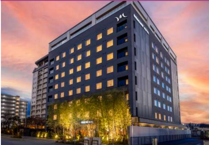
Mercure Hida Takayama