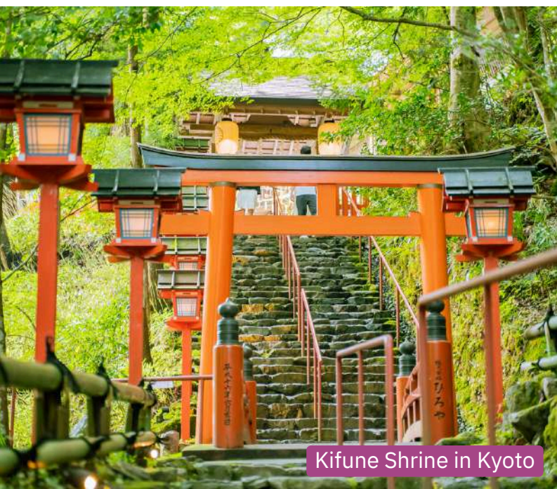
Kifune Shrine in Kyoto