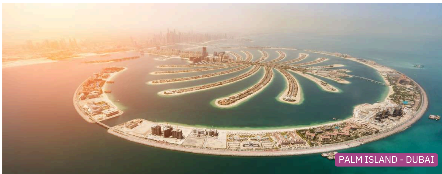
PALM ISLAND - DUBAI