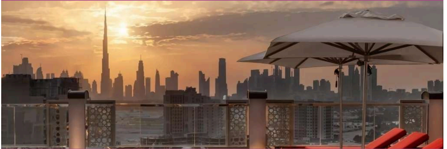
Jw Marriott Marquis Hotel Dubai

A vivacidade é a flor que floresce da saúde.