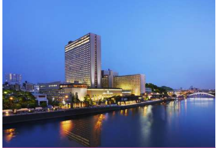
RIHGA Royal Hotel Osaka