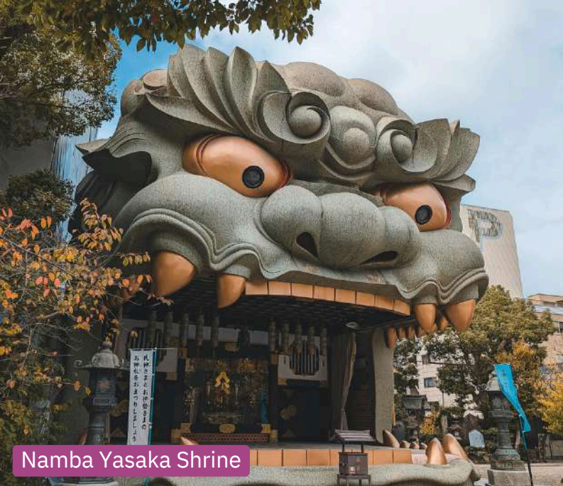
Namba Yasaka Shrine