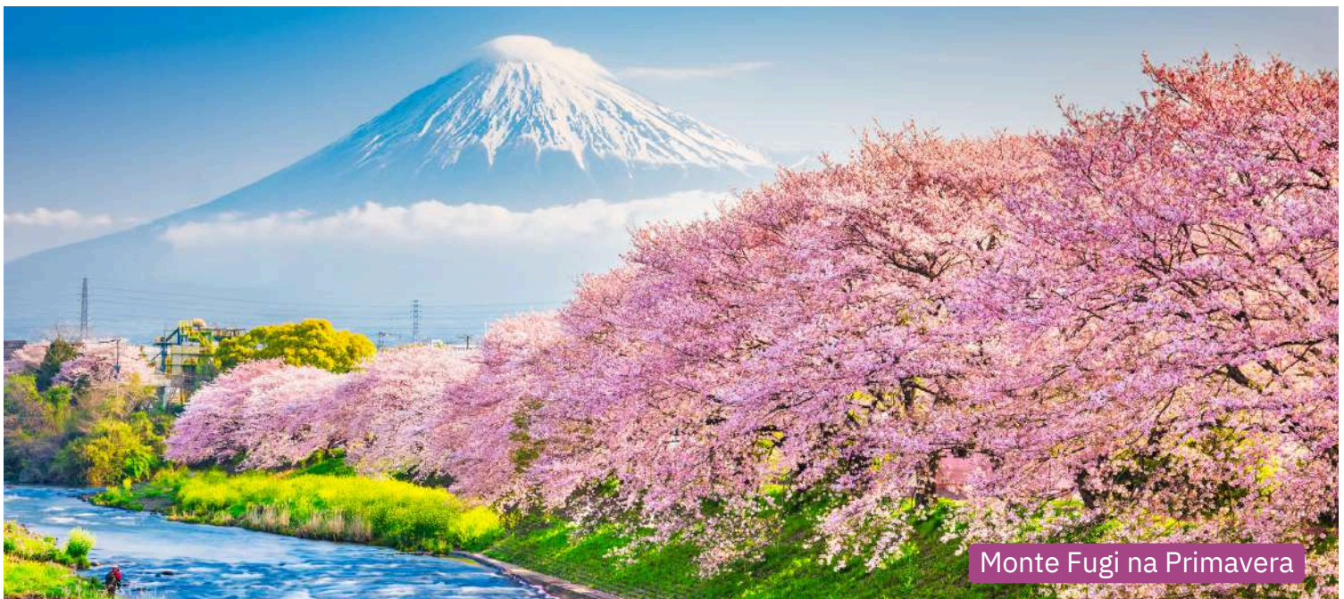
Monte Fuji na Primavera

Após os procedimentos de imigração, traslado até o hotel. Check-in e tempo livre para descanso.