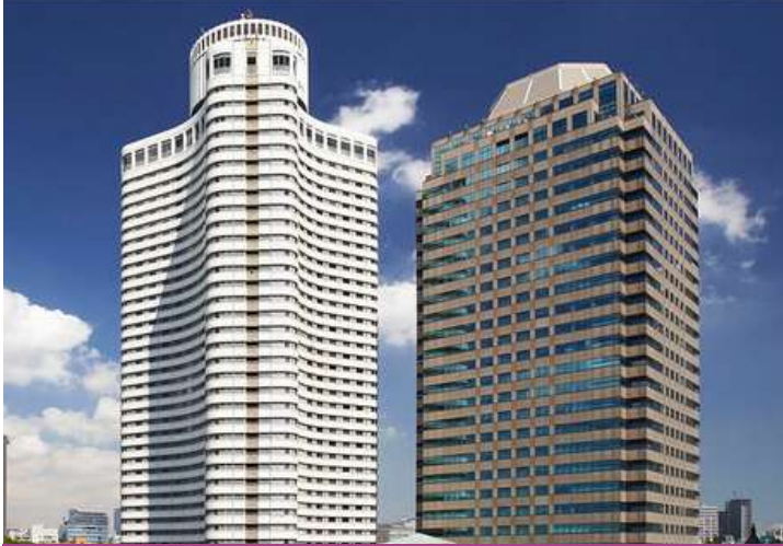
New Otani The Garden Tower