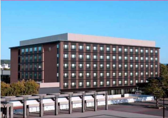
The Royal Park Hotel