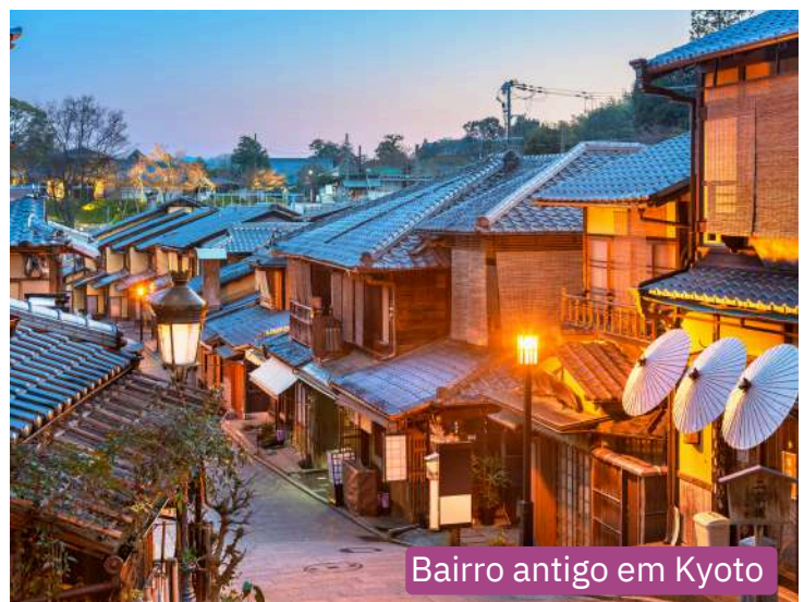
Bairro antigo em Kyoto

Por fim visitaremos o Dotonbori & Shinsaibashi, uma área vibrante e iluminada por letreiros de néon, famosa pela vida noturna, restaurantes e o icônico letreiro do corredor Glico. Shinsaibashi é o principal distrito de compras de Osaka, com a rua coberta Shinsaibashi-suji repleta de lojas, boutiques e marcas internacionais. Retorno ao Hotel. Pernoite em Osaka.